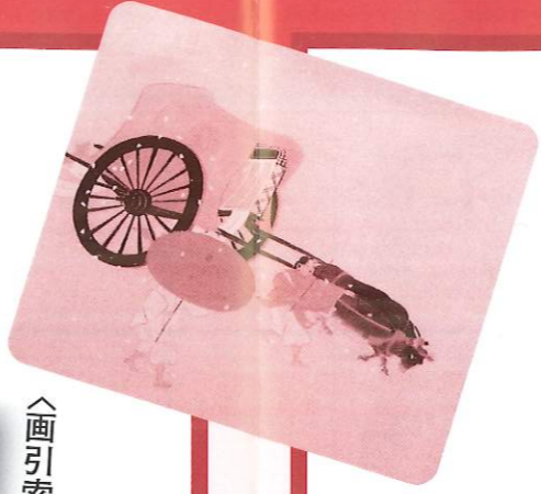
〈画引索引見本・原寸〉