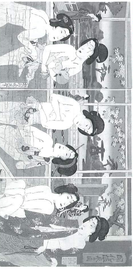
箱根温泉遊覧之図・部分(国安、文政)

温泉医学者の藤浪剛、西川義方両先生の温泉資料への強い情熱と膨大な資料収集に刺激され温泉医学のわたらに温泉資料の収集を始めて五十年。収集した膨大な温泉資料から錦絵、版画を厳選編集し、温泉文化の面から日本の温泉文化をたどってみようとしたのが本書である。温泉が日本人の生活文化となった歴史の流れを本書収載の錦絵や版画を楽ししみながら探っていただければ幸いです。