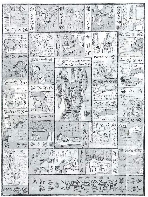
上州草津名所旧跡温泉細見双六(芳虎、安政6年)